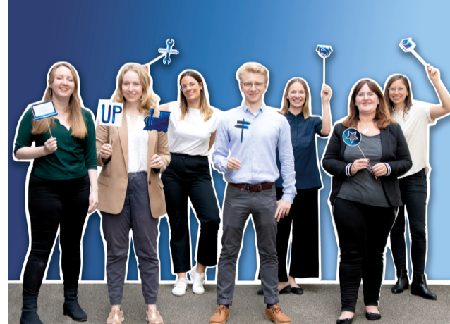
Das Team der Projektkoordination

Vom 26. - 28. Oktober 2021 findet in Köln der 10. VDV-Personalkongress statt. Er wird veranstaltet von der VDV-Akademie und den Kölner Verkehrs-Betrieben (KV). Der diesjährige Kongress steht im Zeichen des 20-jährigen Jubiläums der VDV-Akademie und legt den inhaltlichen Schwerpunkt auf aktuelle und zukünftige digitale Herausforderungen, neue Qualifikationen und Bildungsperspektiven.